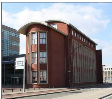
Kantorengedouw "De Locomotief"

Euverman Temmink & Partners is een gerenommeerd makelaarskantoor dat niet alleen lokaal en regionaal een in het oog lopende marktpositie bezit, maar ook met en voor landelijke partijen bemiddelt in bedrijfsmatig onroerend goed. Onafhankelijk bij taxaties, maar zeer partijdig en betrokken bij onderhandelingen.